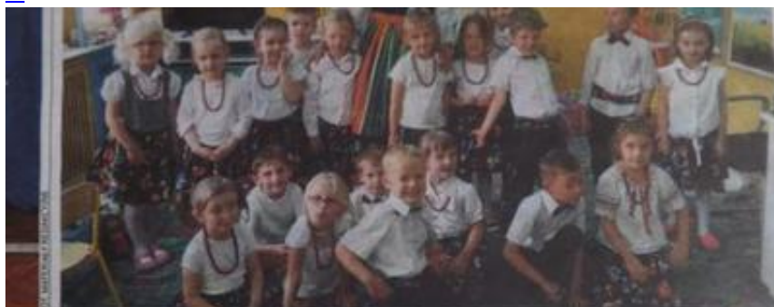
Grupa III - Przedszkole Gminne, Józefów 8, Rogów